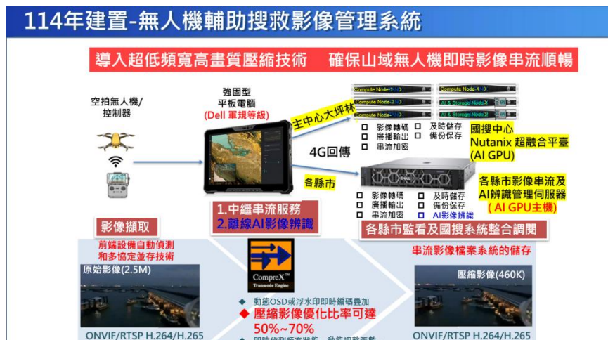
圖 3 無人機輔助搜救影像管理系統

B. 建置「無人機輔助搜救影像管理系統」平臺，此平臺需具備高速 AI 影像辨識性能，可同時執行本案無人機搜索影像串流之即時辨識，透過無人機串流平臺傳送至 AI 伺服器進行「搜救專用」影像辨識，並將辨識發現即時回應給無人機操作人員，可大幅提升山域及複雜地形無人機偵搜效率。